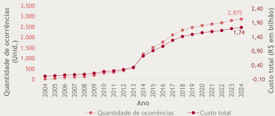
Passageiros não transportados X Custo dos passageiros não transportados 2 (2004-2024)