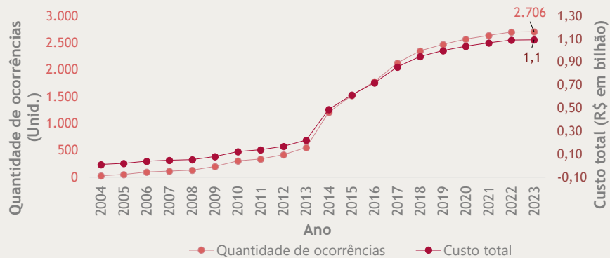
Passageiros não transportados X Custo dos passageiros não transportados 2 (2004-2023)