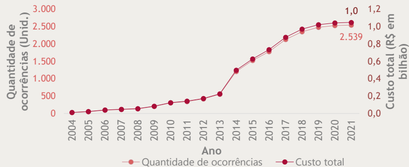
Passageiros não transportados X Custo dos passageiros não transportados 2 (2004-2021)